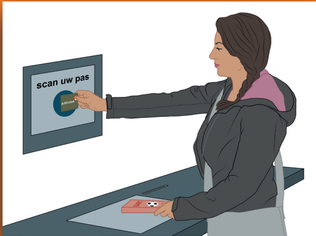
5 Hou het pasje voor de scanner