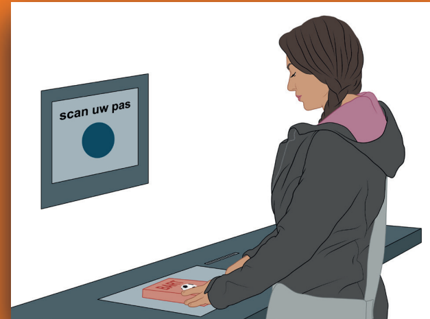
6 Leg het boek op de scanner op de tafel