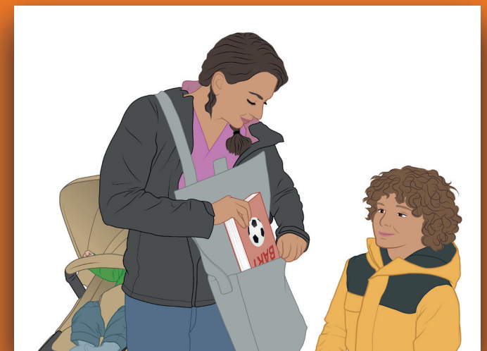
8 Doe het boek in een tas